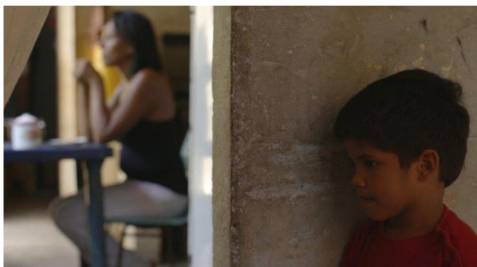
Femmes du chaos vénézuélien

Le festival visages débute le vendredi 22 mars au Cinéma Casino à 18h00, avec un film exceptionnel en avant-première : Femmes du chaos vénézuélien , en présence de la réalisatrice Margarita Cadenas . Le film distingué par Amnesty International, est au cœur de l'actualité. Cinq femmes de générations différentes, racontent par leur histoire, le drame vénézuélien, drame qui nous concerne tous. Le film est interdit au Venezuela. L'équipe du film n'apparaît pas dans le générique, par sécurité pour leur vie.